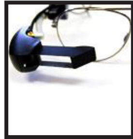
Parte de las gafas que permiten ver subtítulos

Las gafas reciben la señal de un ordenador que hay en la sala y la proyecta en una micropantalla. Pueden funcionar durante 3 horas y son muy fáciles de utilizar.