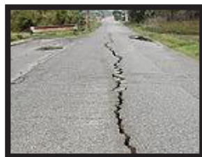
Grieta en la carretera, consecuencia de unos de los sismos

Los servicios de emergencia en Chile están preocupados por la salud mental de casi 35.000 personas. Viven en una zona que ha sufrido una ola de sismos. Desde finales de enero han registrado miles de temblores en Puerto Aysén y Puerto Chacabuco, en el sur del país.