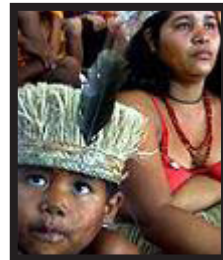
Indígenas del Amazonas

El principal organismo de derechos humanos en América Latina ha ordenado al gobierno peruano una rápida actuación. Es necesario para proteger a las tribus aisladas del Amazonas de los leñadores que entran de forma ilegal en sus territorios.