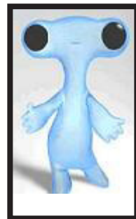
Mascota de la Expo 2008

La organización de la Expo Zaragoza 2008 ha convocado un concurso público. Piden la composición del himno de la muestra internacional. El elegido va a conseguir 85.000 euros. El plazo de la presentación de las propuestas finaliza el 30 de abril. La decisión definitiva del jurado va a ser el 14 de mayo.