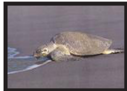
Una tortuga de la especie baulas

Varias agrupaciones medioambientales han organizado una “gran carrera de tortugas”. Once tortugas hembras de la especie baulas han iniciado el lunes su camino entre el Pacífico de Costa Rica, y la islas Galápagos (Ecuador).